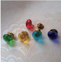
▲ピンブローチはお好きな色を1つ選べます

4月26日から5月6日までのゴールデンウィークの期間中、展覧会の内容を楽しみながらより深く学べるように、展示作品に関するクイズが掲載されたお子様向け「作品鑑賞ガイド」を配布します。ガイドの中のクイズに挑戦してくれた幼児・小・中学生のお客様には、ガラスのピンブローチをおひとつプレゼントします。